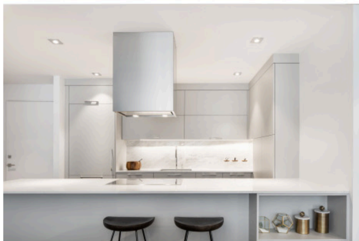
La cuisine est la pièce maîtresse de l'unité gagnante de Bassins du Havre.

Située aux abords du canal de Lachine, entre les rues de la Montagne et Guy, cette résidence haut de gamme a remporté le grand prix dans le volet de 325 000$ à 500 000$ grâce à son style épuré, ses plafonds de 2m75 de hauteur et son imposante fenestration.