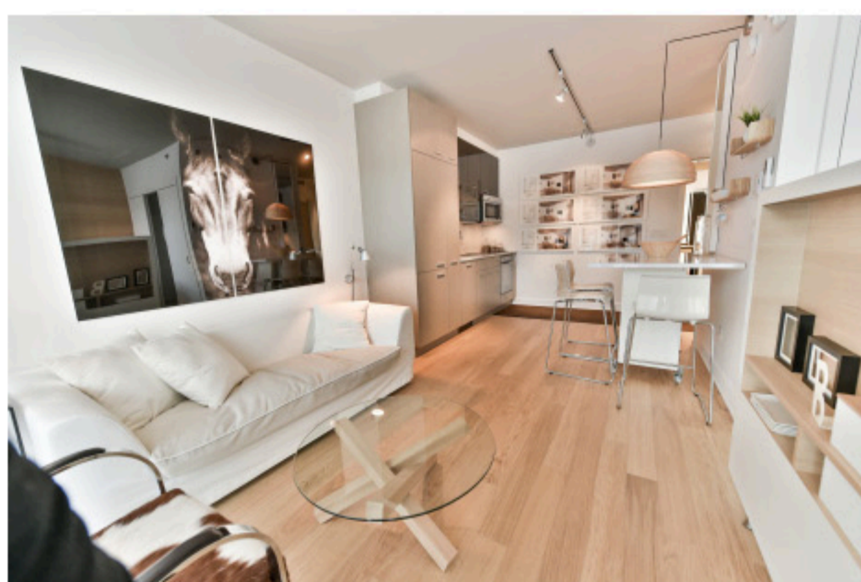
L'unité d'habitation gagnante de Lowney sur Ville

Dans la catégorie moins de 325 000$, les condos de Lowney sur Ville, les pionniers dans Griffintown, ont brillé avec leur projet immobilier situé à l'angle des rues Ann, Shannon et Ottawa. L'unité gagnante a été pensée pour répondre aux attentes des jeunes professionnels. D'une grandeur de 60 mètres carrés, elle compte deux chambres et est stratégiquement emménagée pour créer un maximum d'espace dans un minimum de superficie.